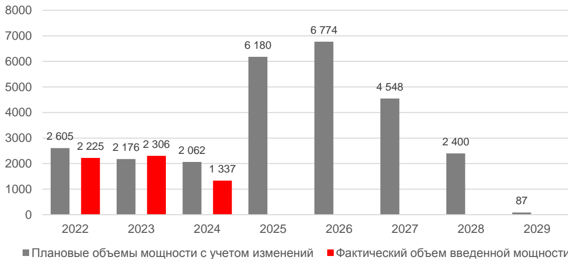
Рис. 2 Плановый (с учетом изменения периодов модернизации и поставки мощности, а также параметров объектов) и фактический объем мощности модернизируемых объектов генерации, МВт.

Всего за весь период до 30.06.2024 введено 26 объектов генерации установленной мощностью 5 868,4 МВт, при плане в 29 объектов генерации установленной мощностью 6 168,2 МВт. Исполнение плана составляет 95,1%.