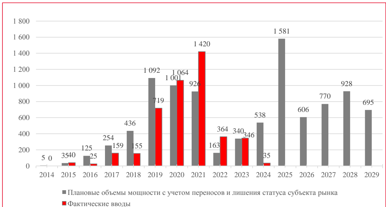
Рис. 2 «Плановые и фактические показатели ввода мощности (с учетом переноса даты начала поставки мощности и изменений, связанных с лишением права участия по ГТП ДПМ ВИЭ), МВт».

В период с 2014 г. по 1 квартал 2024 г. включительно введено 200 объектов генерации установленной мощностью 4 326,4 МВт, при плане ввода 202 объектов генерации (с учетом изменений, связанных с заменой отобранных объектов и прекращением и/или отсутствием действующих ДПМ ВИЭ) установленной мощностью 4 376,2 МВт. Исполнение плана составляет 98,9%.