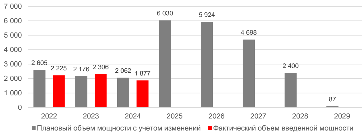
Рис. 2 Плановый (с учетом изменения периодов модернизации и поставки мощности, а также параметров объектов) и фактический объем мощности модернизируемых объектов генерации, МВт.

Всего по состоянию на 31.12.2024 введен 31 объект генерации общей установленной мощностью 6 408,2 МВт, при плане в 35 объектов генерации общей установленной мощностью 6 843,2 МВт. Исполнение плана составляет 93,6%.