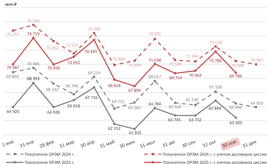
Задолженность покупателей, лишенных статуса субъекта ОРЭМ