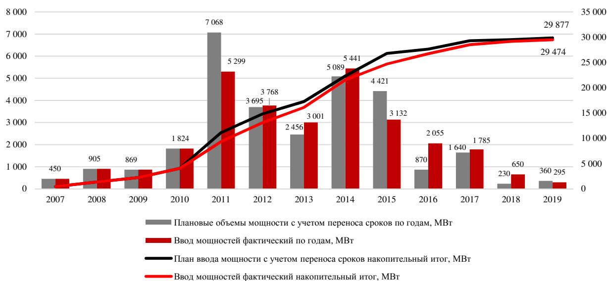
Рис. 1 «График вводов мощности с учетом переносов сроков начала поставки мощности, МВт. 2007-2019 гг.»

Тепловые генерирующие компании (ОГК/ТГК) и компания, осуществляющая деятельность по экспорту/импорту энергии, заключили Агентские договоры (далее – АД) с целью поставки мощности по договорам о предоставлении мощности (далее – ДПМ). Всего было заключено 34 Агентских договора, из которых: 23 договора, обеспечивающих реализацию инвестиционных программ ОГК/ТГК (с контролем строительства), и 11 договоров, обеспечивающих заключение и исполнение ДПМ введенных в эксплуатацию генерирующих объектов (без контроля строительства). Данные договоры были заключены 01.11.2010 г. в соответствии с Правилами оптового рынка и условиями Договора о присоединении к торговой системе оптового рынка в отношении объектов генерации, включенных в Распоряжение Правительства от 11.08.2010 г. № 1334-р. В связи с реорганизацией Принципалов и изменением состава договоров к настоящему времени генерирующими компаниями заключено 44 1 Агентских договора. Общий объем генерирующих мощностей, который планируется ввести в срок до конца 2019 г. в рамках реализации обязательств по заключенным ДПМ составил 29 876,75 МВт, по 136 объектам генерации (подробнее см. рис.1).