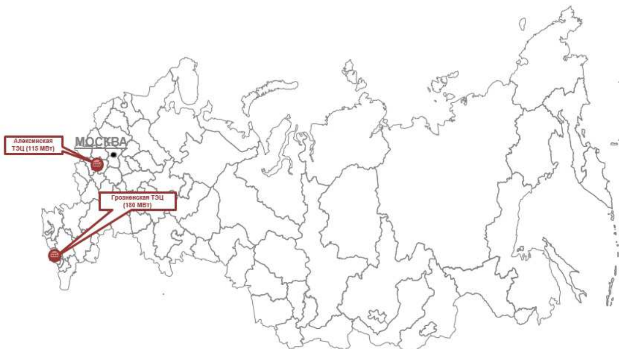
Рис. 2 «Введенные в 2019 году объекты генерации»