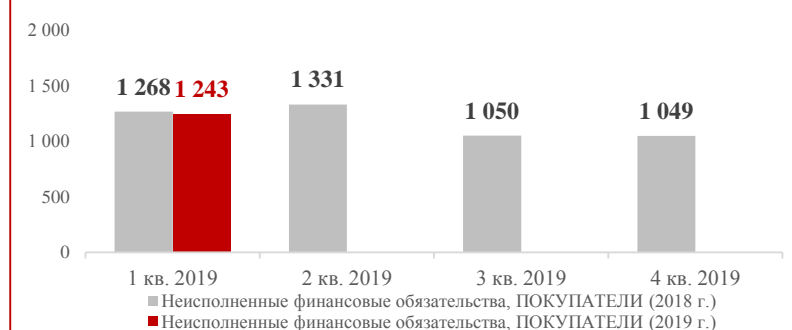
НЕИСПОЛНЕНИЕ ФИНАНСОВЫХ ОБЯЗАТЕЛЬСТВ В РАМКАХ ФУНКЦИОНИРОВАНИЯ СИСТЕМЫ ФИНАНСОВЫХ ГАРАНТИЙ НА ОРЭМ млн. руб.